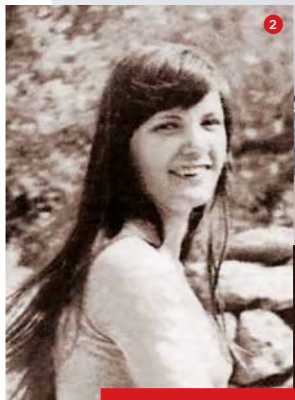
Uspomene na redovnički život (1), prije kojeg je u Dubrovniku završila srednju medicinsku školu (2). Kao časna sestra bila je posvećena borbi protiv droge i brizi za ovisnike (3). Prije 20 godina napustila je red ančela (4)